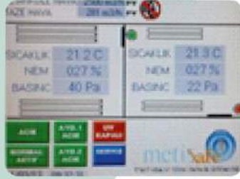
OTOMASYON KONTROL EKRANI