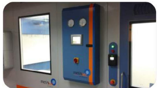
OTOMASYON KONTROL PANOSU