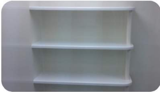
TEMİZ ODA RAFLARI