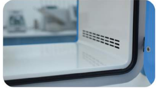
ELEKTROMANYETİK KAPAK KİLİT SİSTEMLİ HEPA FİLTRELİ, UV LAMBALI DİNAMİK PASS-BOX