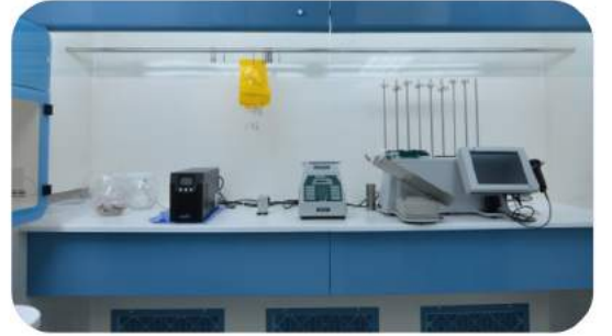
TEMİZ ODA ENTEGRE LAMİNAR HAVA AKIM KABİNİ