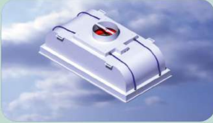
METİSAFE HEPA FAN FİLTRE ÜNİTESİ