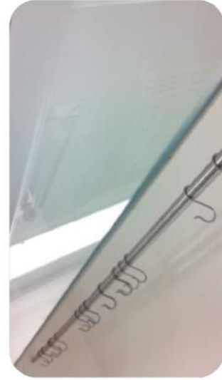
TEMİZ ODA ASKI APARATI