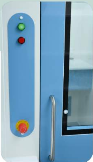
INTER-LOCK KAPI KİLİT SİSTEMİ ACİL AÇMA BUTONU