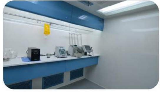
METİSAFE'E ÖZGÜ SIZDIRMAZ DUVAR VE TAVAN PANEL BAĞLANTILARI