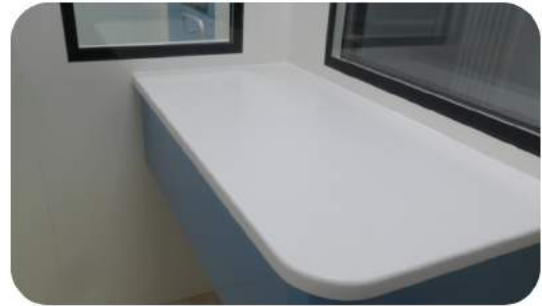
ASİT DİRENÇLİ ÇALIŞMA TEZGAHI

metisafe Metis Biyoteknoloji'nin tescilli markasıdır.