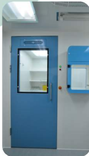
OTOMATİK GİYÖTİN MEKANİZMALI HAVA TAŞIRMA MENFEZLİ KAPI