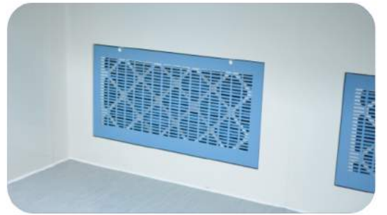
ANTİ-STATİK ZEMİN HAVA EMİŞ MENFEZLERİ